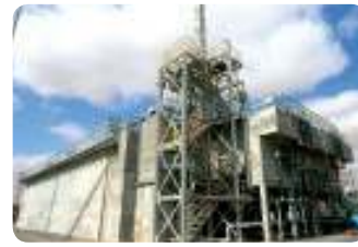
מפעל ייצור כימיקלים, רמת חובב מתקן MBR לטיפול בשפכים תעשייתיים, פרוייקט Turn Key 2500 מק"י