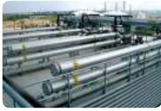
מפעל מיקרואלקטרוניקה, מרכז הארץ מתקן MBR לטיפול בשפכים תעשייתיים, 6300 מק"י