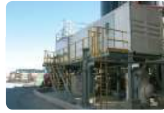
מתקן סניטארי, רמת חובב 2 מתקני MBR לטיפול בשפכים תעשייתיים, 120 מק"י