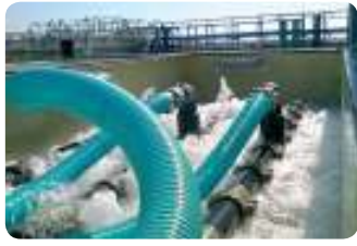
מתקן סניטארי, רמת חובב מתקן MBR לטיפול בשפכים סניטאריים, 300 מק"י