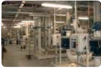
מפעל מיקרואלקטרוניקה, מרכז הארץ מתקן Ultra Pure Water