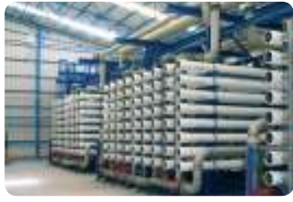
מעגן מיכאל מתקן RO להתפלת מים מליחים 27,000 מק"י