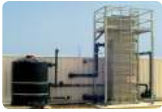
שפדן מתקן הדגמה לטיפול שלישוני בטכנולוגית RO-UF