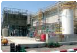
תעשייה פרמצבטית, רמת חובב מתקן MBR לטיפול בשפכים תעשייתיים פרוייקט Turn Key 800 מק"י