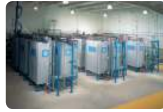
ספאריה (מקורות) מתקן EDR להרחקת ניטראטים ממי שתייה