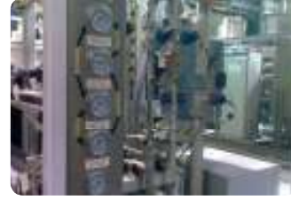
תחנת כוח באשקלון מתקן UPW טכנולוגית EDI להרחקת יונים לפני דוודי קיטור

ניתן לקבל אינפורמציה נוספת לגבי פרוייקטים אלו ונוספים.