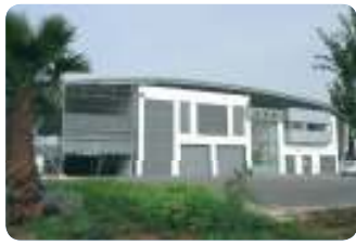
נתב"ג 2000 (מקורות) מתקן MBR לטיפול בשפכים מוניציפאליים ותעשייתיים, 3750 מק"י